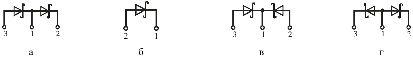
Рисунок 1 – Схема соединения модуля

Сведения о содержании драгоценных материалов и цветных металлов представлены в приложении А.