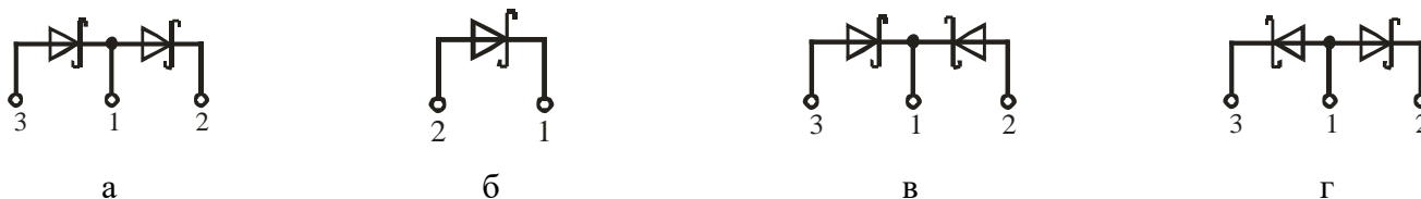
Рисунок 1 – Схема соединения модуля

Сведения о содержании драгоценных материалов и цветных металлов представлены в приложении А.